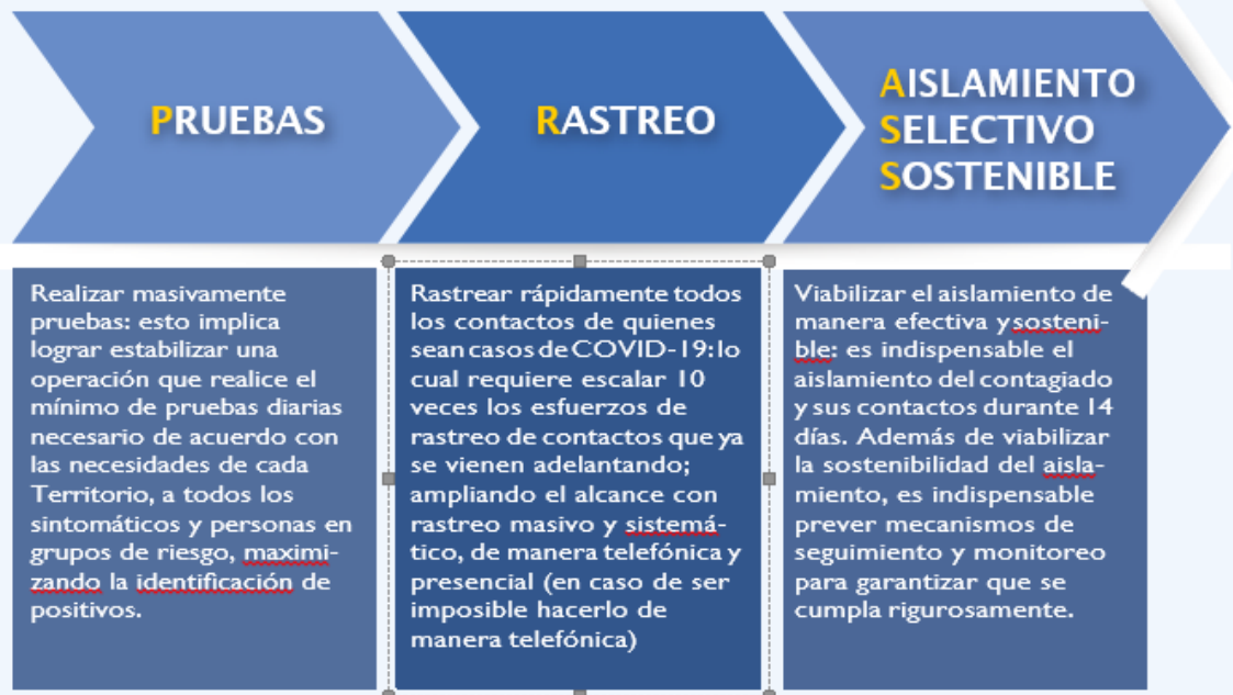
Ilustración 2. Frentes de Acción PRASS